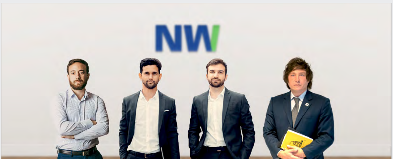
Javier Milei y Agustín Laje forman parte del equipo de capacitadores de N&W.

Estrategia NW2 (update) / Psicotrading avanzado / Gestión del riesgo / Backtesting.